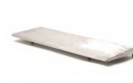
10"X30" HOT PLATE