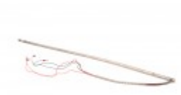
Hot rod for bander 23