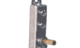
Thermostat for Bander/KWIK-SEAL