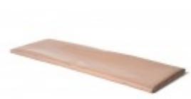
Teflon cover 10" x 30"