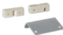
RETROFIT KIT FOR BANDER