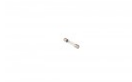
FUSE FOR BANDER