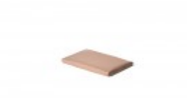
Teflon cover 6" x 9"