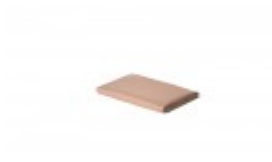
Teflon cover 6" x 9"