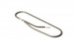
HOT PLATE ELEMENT