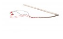
HOT ROD FOR MINI BANDER 15"