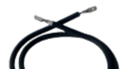
Spiral shaped element for TT69