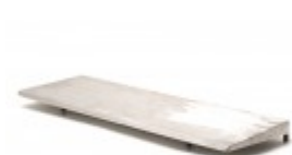
10"X30" HOT PLATE