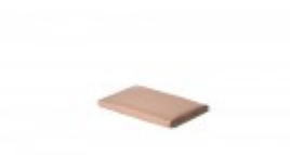
Teflon cover 6" x 9"