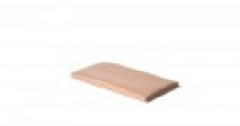
Teflon cover 6" x 14"