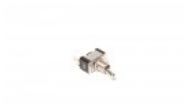
ON/OFF TOGGLE SWITCH FOR BANDER