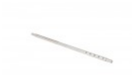
FILM AXLE FOR BANDER 22"