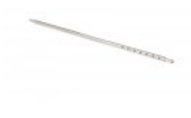
FILM AXLE FOR BANDER 28"