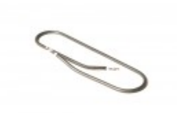
HOT PLATE ELEMENT