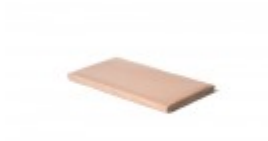
Teflon cover 8" x 15"