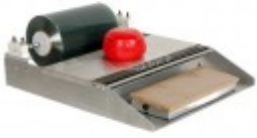
Heat Seal Single Roll Film Wrapper

Dimensions 26" D x 22"W x 9" H 115 volt, 6.5 amp, 60 cycles 20 watts 19 lbs. Use 6" x 15" teflon hot plate cover