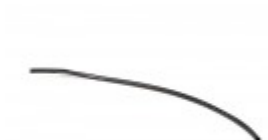
VINYL COVER FOR FILM GUIDE ROD FOR 625A BANDER