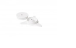
FILM CORE FOR BANDER Sold by pair