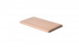
Teflon cover 8" x 15"