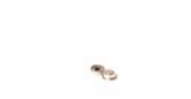
FILM GUIDE CAP FOR BANDER