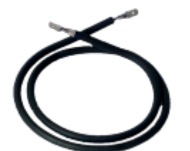
Spiral shaped element for TT69