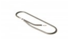
HOT PLATE ELEMENT