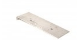
PLATE RETAINING ELEMENT