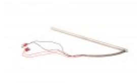
HOT ROD FOR MINI BANDER 15"