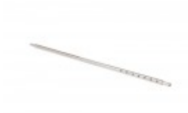
FILM AXLE FOR BANDER 28"