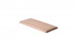
Teflon cover 6" x 15"