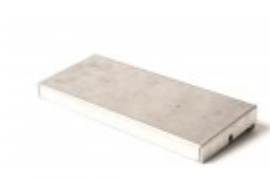
HOT PLATE 6"X15", NO ELEMENT