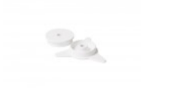
FILM CORE FOR BANDER Sold by pair