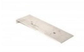
PLATE RETAINING ELEMENT