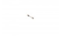
FUSE FOR BANDER