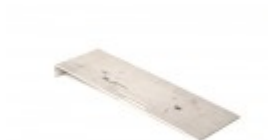
PLATE RETAINING ELEMENT