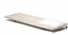
10"X30" HOT PLATE