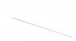
FILM GUIDE ROD FOR 625A BANDER