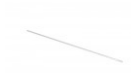
FILM GUIDE ROD FOR 625A BANDER