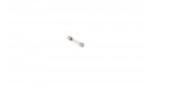
FUSE FOR BANDER