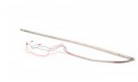
Hot rod for bander 23"