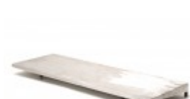
10"X30" HOT PLATE