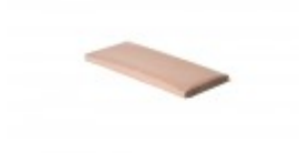
Teflon cover 6" x 15"

Dimensions 26" D x 22"W x 9" H 115 volt, 6.5 amp, 60 cycles 20 watts 19 lbs. Use 6" x 15" teflon hot plate cover