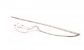
HOT ROD FOR BANDER 36"