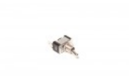
ON/OFF TOGGLE SWITCH FOR BANDER