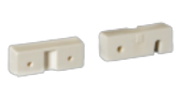
BRAKE BLOCK FOR BANDER