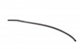
VINYL COVER FOR FILM GUIDE ROD FOR 625A BANDER