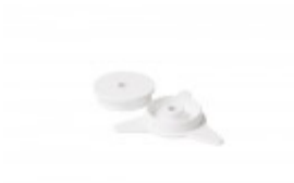
FILM CORE FOR BANDER Sold by pair