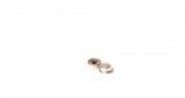
FILM GUIDE CAP FOR BANDER