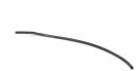
VINYL COVER FOR FILM GUIDE ROD FOR 625A BANDER