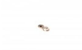
FILM GUIDE CAP FOR BANDER