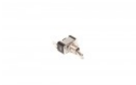
ON/OFF TOGGLE SWITCH FOR BANDER