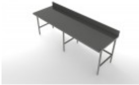
30"X96" S/S WORK TABLE