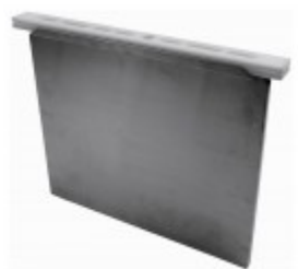
S/S DROP IN KNIFE POUCH (FEKP)