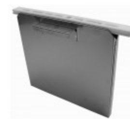
S/S CLIP ON KNIFE RACK