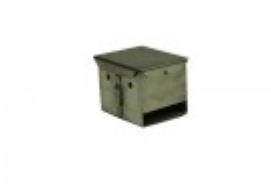
STAINLESS STEEL TWINE SPOOL HOLDER