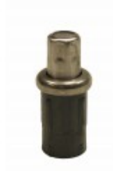
S/S BULLET FOOT