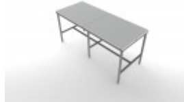
30"X72" FULL SANI KLEEN CUTTING