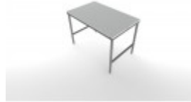
30"X48" FULL SANI KLEEN CUTTING