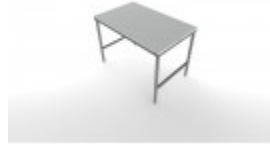
30"X48" FULL SANI KLEEN CUTTING